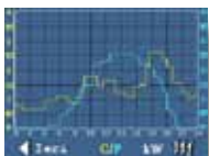
Grafico produzione e consumi

Misurazione assorbimenti e gestione auto-consumo