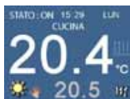
Regolazione temperature zone