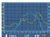
Grafico produzione e consumi