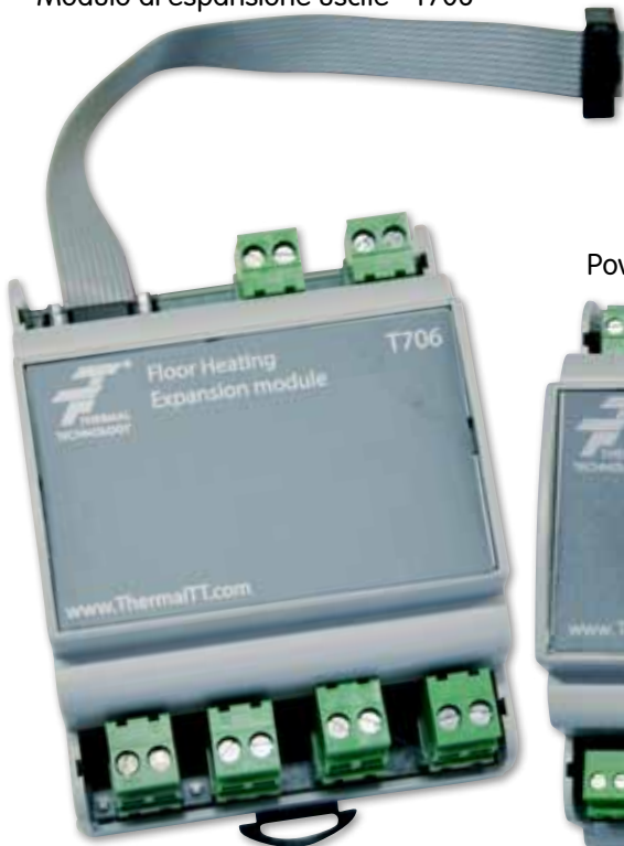
Modulo di espansione uscite - T706