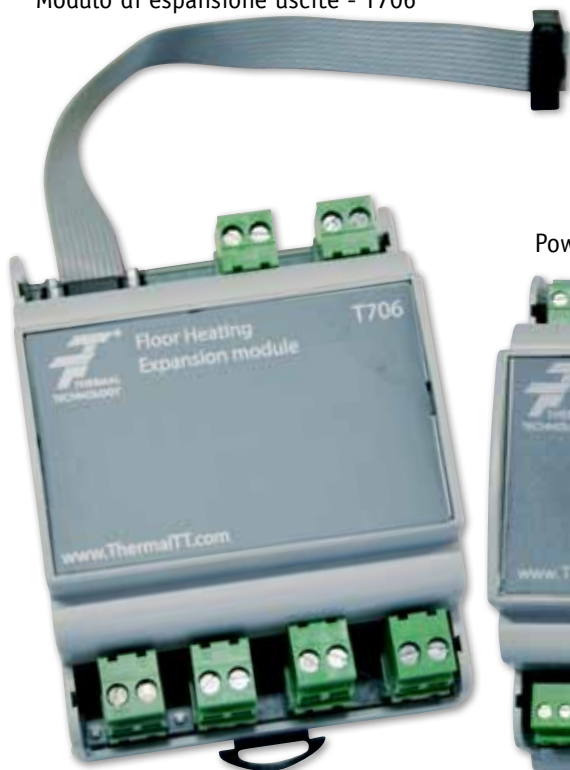
Modulo di espansione uscite - T706