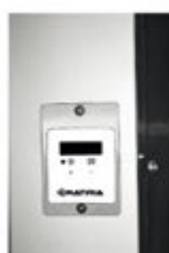
Centralina elettronica sostituibile

Centralina elettronica facilmente sostituibile, sonda ambiente estendibile sino a 3,00 metri.